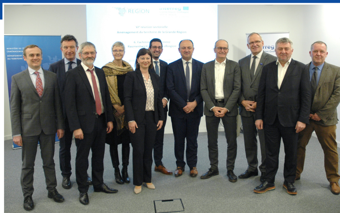
Photo de famille. De gauche à droite: PHILIPPE VOIRY, Préfecture Grand Est ; FRANCK LEROY, Région Grand Est; HANS-PETER RUPP, Saarland; VALÉRIE BEAUSERT-LEICK, Département de Meurthe-et-Moselle; NICOLE STEINGASS, Rheinland-Pfalz; ANTONIOS ANTONIADIS, Deutsch Gemeinschaft Belgiens ; WILLY BORSUS, Wallonie; CLAUDE TURMES, Grand-Duché de Luxembourg; PATRICK WEITEN, Département de la Moselle; EDOUARD JACQUE, Région Grand Est; STÉPHANE PERRIN, Département de la Meuse.

Am 16. Januar 2020 empfing der luxemburgische Minister für Raumentwicklung, Claude Turmes, seine Amtskollegen aus der Großregion zur 6. Fachministerkonferenz für Raumordnung .