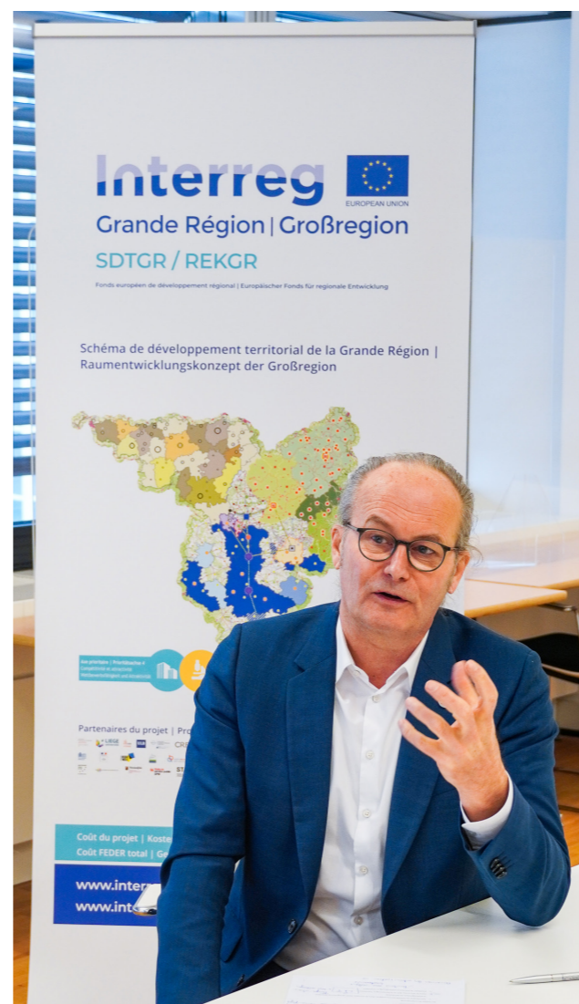
Claude Turmes, ministre de l'Aménagement du territoire - Webinaire de clôture (08/02/2022).

2021 wurde ein externer Dienstleister, Spatial Foresight, mit der Ausarbeitung präziser Empfehlungen für die Umsetzung der Strategie in den Planungsdokumenten der verschiedenen Partner beauftragt. In diesem Zusammenhang wurden durch den externen Dienstleister Experteninterviews in allen Teilgebieten durchgeführt. Darüber hinaus wurde für jeden strategischen Schwerpunkt eine Karte erstellt, die gegebenenfalls in die Planungsdokumente der verschiedenen Partner übernommen werden kann.